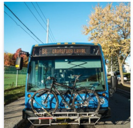
Support à vélo pour autobus