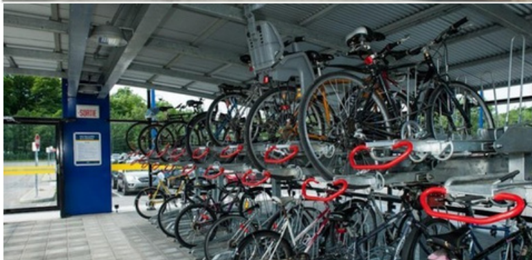
Vélo-Station / Abri Vélo à Montréal