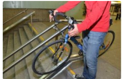
Glissoires à vélo pour descente d'escaliers