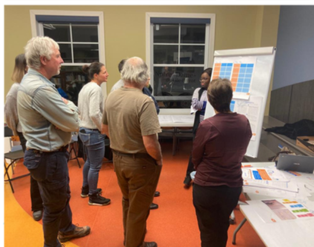
Passage en revue et validation des enjeux identifiés lors des premières étapes