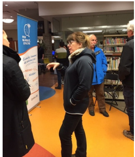
Les échanges après l'atelier