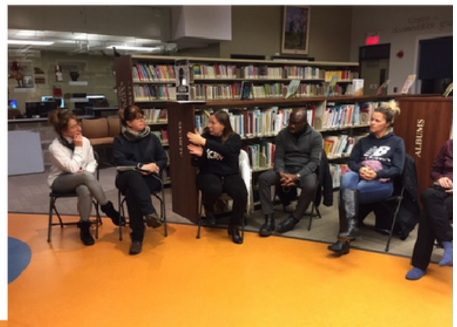
Présentation et analyse des grandes recommandations